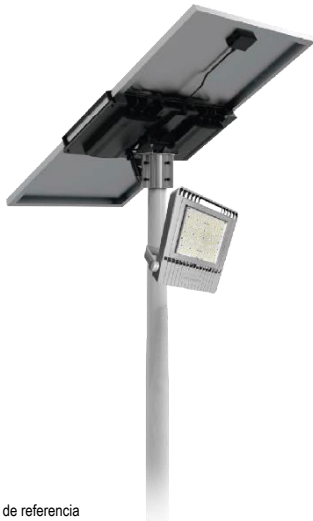
Foto de referencia