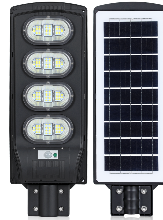
LED LIGHT SOLAR S100/S150/S200/S250/S300 START

***Imagen de referencia, las dimensiones de la luminaria pueden variar de acuerdo con la potencia***